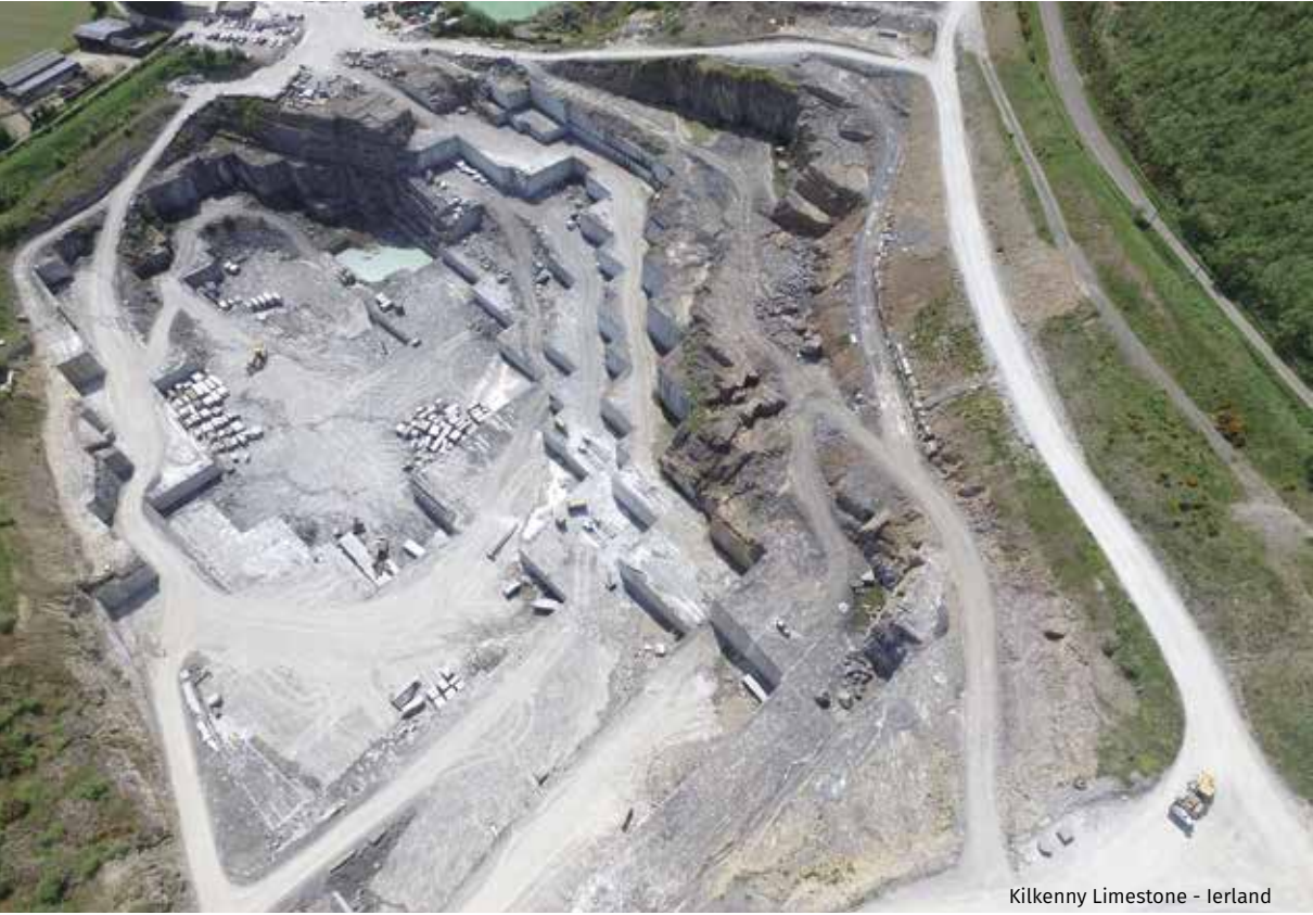
Kilkenny Limestone - Ierland