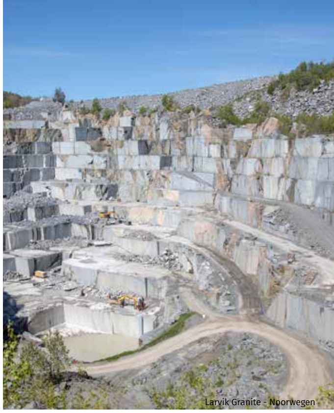
Larvik Granite - Noorwegen